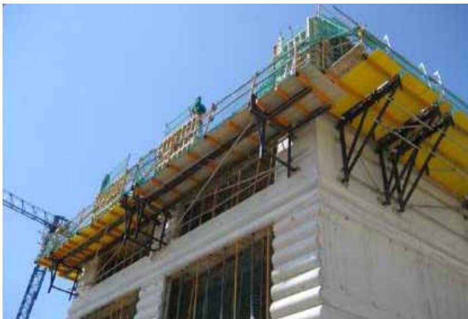
ENVOLUPANT VERTICAL EXTERIOR: FAÇANA PORTANT DE FORMIGÓ VIST IN SITU AMB MOTLLURES

La fase d'estructura es va organitzar i planificar en funció del procediment d'execució per al mur portant de façana, consistent en una façana portant de formigó vist executada in situ , amb unes franges amb relleus corbats i altres parts llises verticals. El relleu en la superfície de formigó s'ha aconseguit amb la utilització d'un motlle de poliestirè expandit recobert amb