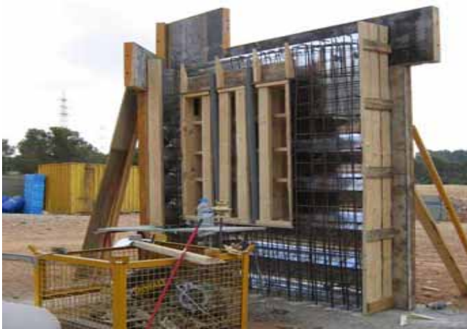
IMATGE DEL SISTEMA D'ENCOFRAT I ARMAT DEL MUR