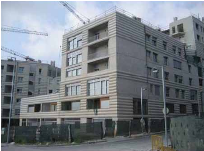
FAÇANA DE L'EDIFICI