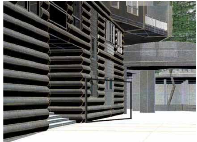
VISTA DE LA PORTA D'ACCÉS A L'APARCAMENT